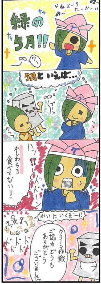
by 南雲風助(なぐもふうすけ)